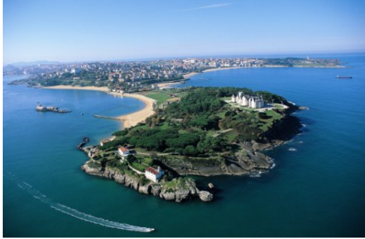
Península de la Magdalena en la Bahía de Santander Se puede divisar desde en ruta desde Puente de Somo

A la llegada a Isla sobre las 19:30 dispondremos tendremos un aperitivo de bienvenida y un vino español. Posteriormente tiempo libre para alojarse, tomar un aperitivo en la cafetería del hotel ó incluso dar un paseo y disfrutar de las playas y vistas de Isla.