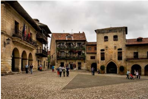
Santillana del Mar – Plaza Mayor

El centro histórico de Santillana del Mar llama la atención por su construcción clásica muy bien conservada, principalmente en 2/3 alturas con fachadas de piedra y sus calles adoquinadas. Destaca la Colegiata de Santillana del Mar, que data del siglo XII