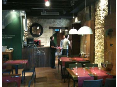
Restaurante-Sidreria Mater Asturias

Tras la comida dispondremos un rato de tiempo libre para visitar Santillana del Mar.