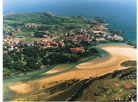
Foto aérea de Isla

La cena será en el propio hotel. Tras la cena tendremos abierto el pub-discoteca del hotel con música y concierto en directo para todo el quiera continuar la fiesta.