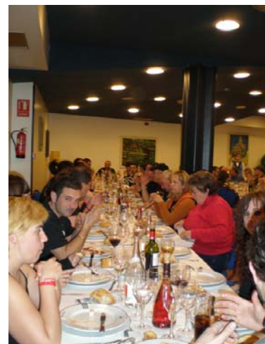
Cena Gala sábado