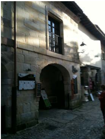
Restaurante-Sidreria Mater Asturias

Tras aparcar nuestras motos y hacernos la foto de grupo de rigor nos dirigiremos andando por el centro peatonal hasta el Restaurante Sidreria Mater Asturias donde dispondremos de un aperitivo sobre las 14:15, seguido de la comida en el propio restaurante. Aquí disfrutaremos un succulento y tradicional Cocido Montañés, seguido de Carrilleras guisadas, postre y cafe (bebidas alcohólicas aparte NO INCLUIDAS EN EL MENU – por razones legales y normativa de HOG España).